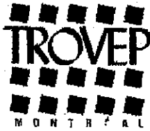
Table régionale des organismes volontaires d'éducation populaire de Montréal