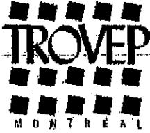
Table régionale des organismes volontaires d'éducation populaire de Montréal